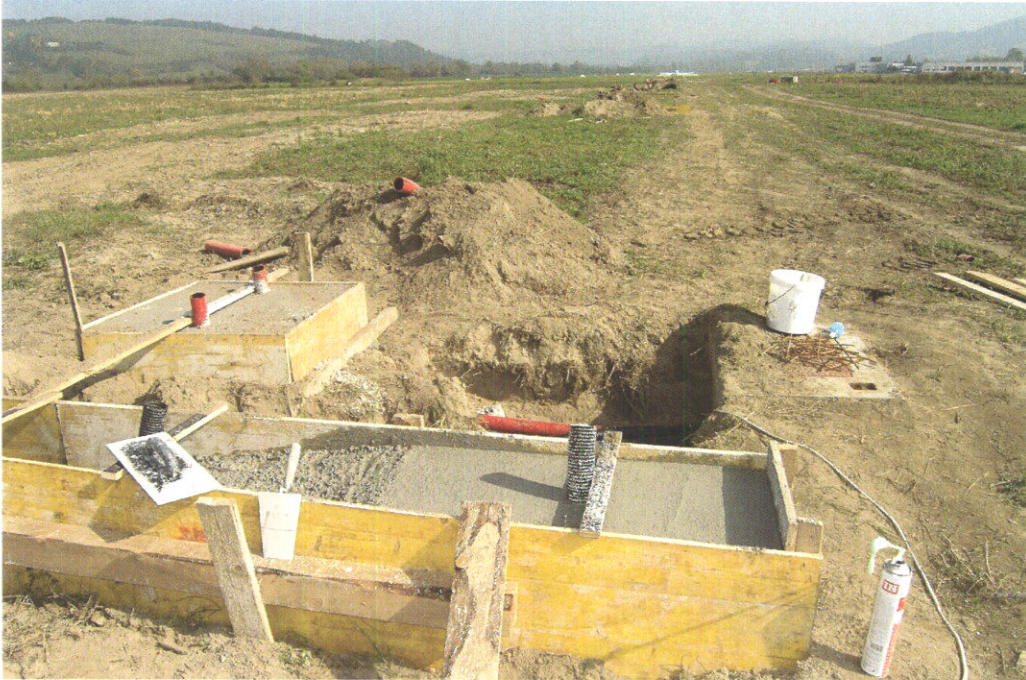
Výstavba montážnych šachiet a kábelovodov k približovacej sústave RWY06.