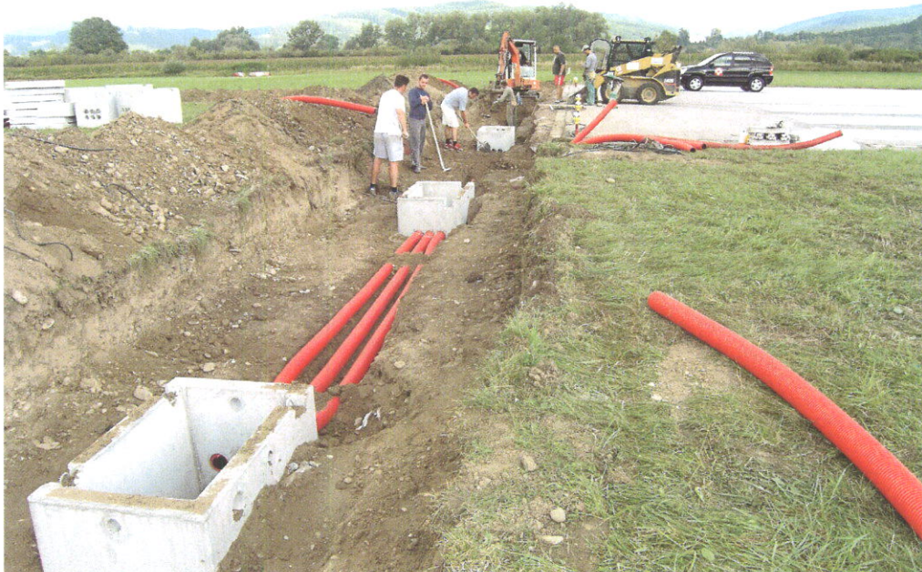
Stavebná príprava k inštalácii prahových návěstídiel RWY 06