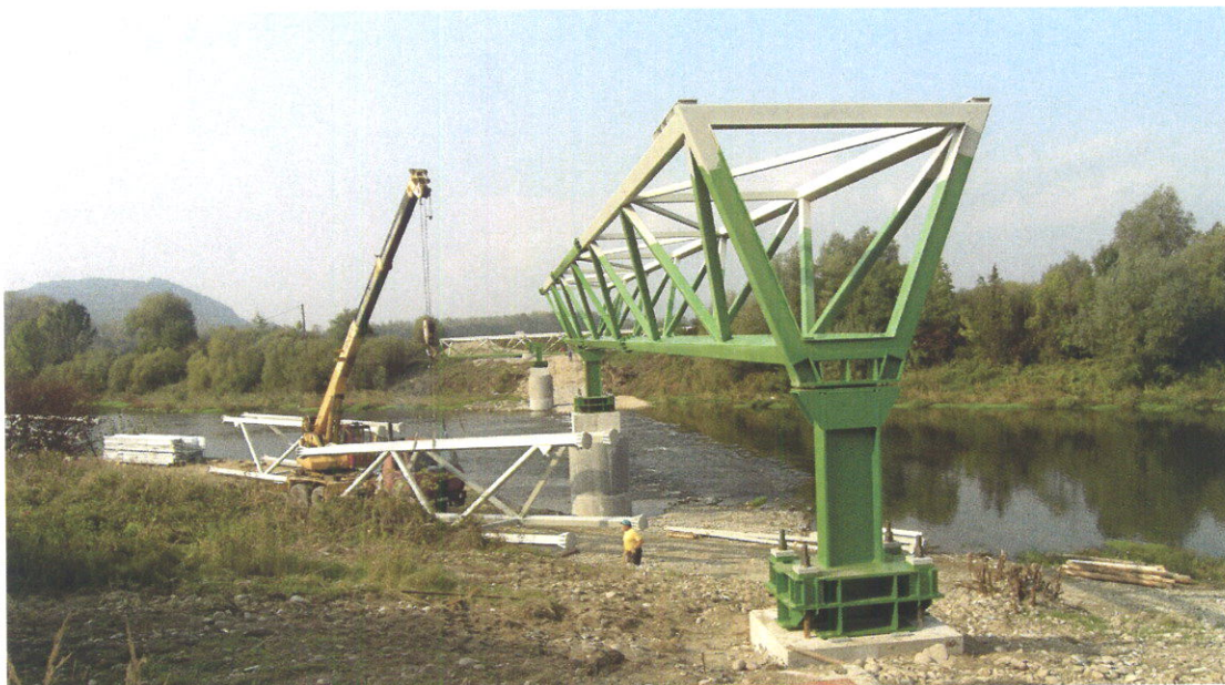
Montáž lávky cez rieku Váh k osadeniu svetelných návestidiel približovacej rady RWY 06.

K certifikácii letiska na podmienky priblíženia I. kategórie je nutné navigačné zariadenie systému ILS, ktorého inštaláciu vykoná v roku 2009 Letové prevádzkové služby š.p. Bratislava. Ďalšou podmienkou je vyhlásenie nových ochranných pásiem letiska Leteckým úradom SR a viacero prevádzkových a administratívnych opatrení.