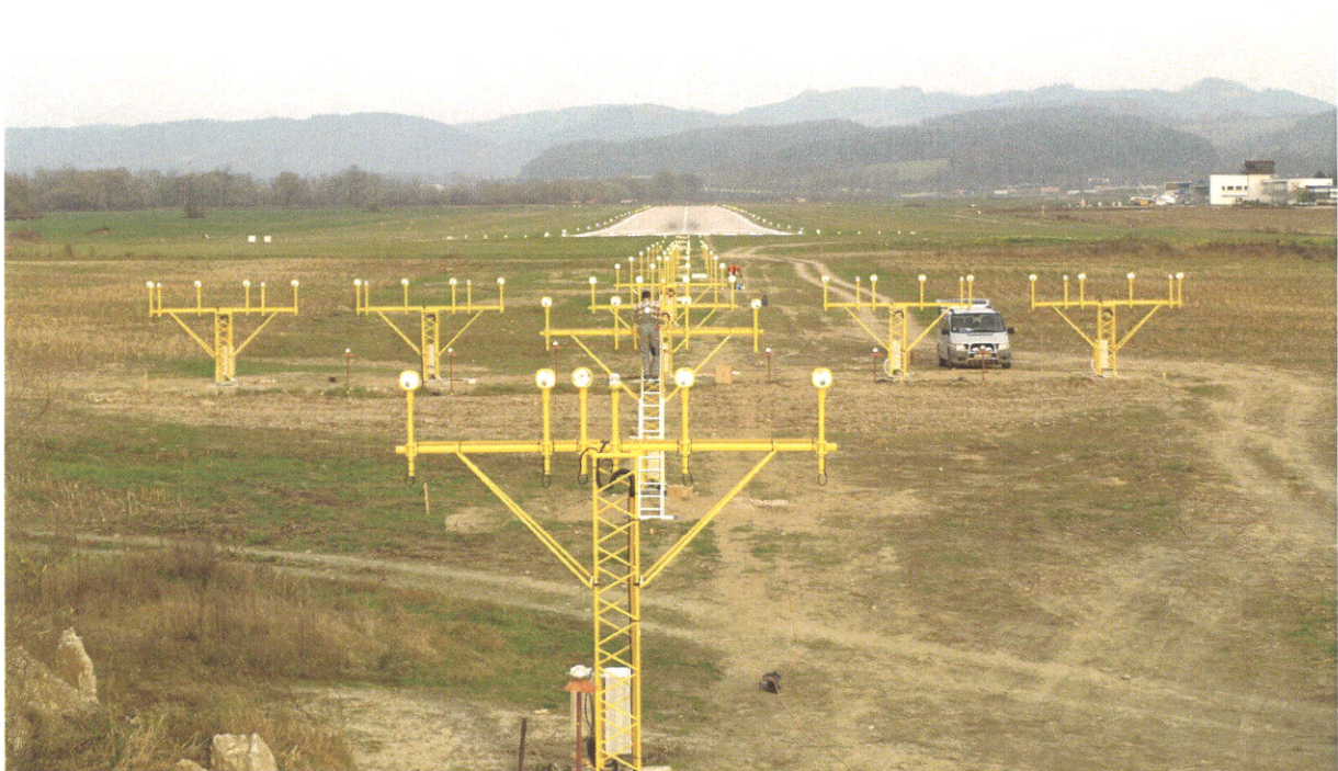
Nová približovacia sústava tesne pred prahom dráhy RWY06.

Dotácie na obstaranie dlhodobého majetku spoločnosť rozpúšťa do výnosov v časovej a vecnej súvislosti so zaúčtovaním odpisov z dlhodobého hmotného majetku, na obstaranie ktorého bola dotácia poskytnutá, od doby zaradenia tohto majetku do užívania.